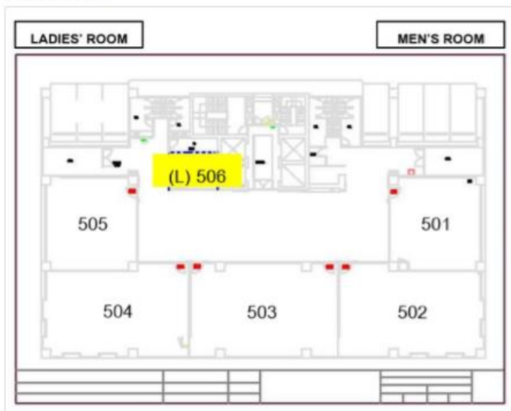
5th Floor plan